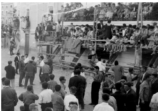
CASTRIL DE LA PEÑA