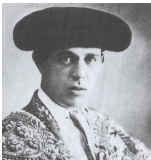
Ignacio Sánchez Mejías

Ignacio Sánchez Mejías nació en Sevilla el 6 de junio de 1891. Su padre, que era médico, quiso que siguiera su profesión, pero el muchacho ni siquiera terminó el Bachillerato (más tarde, siendo ya mayor, obtuvo el título en un solo examen), se escapaba de clase para jugar a torear en compañía de otros chicos de su edad, entre los que destacaba el que luego sería conocido con el mítico nombre de Joselito “el Gallo”.