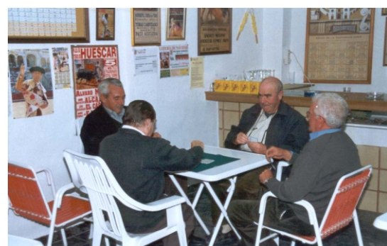
Actividades realizadas con motivo de las II Jornadas Culturales