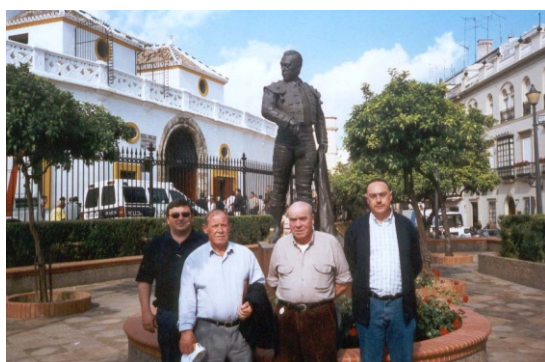
Visita a Sevilla