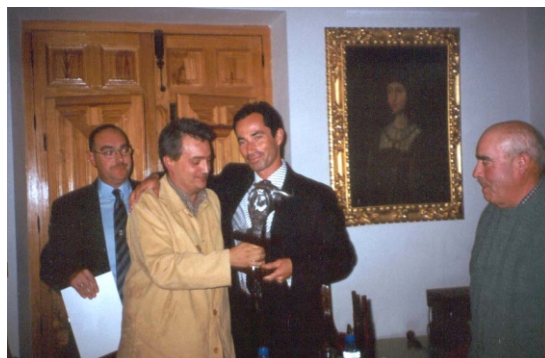
Pregón Taurino, presentación 2º núm. Revista y entrega Trofeos