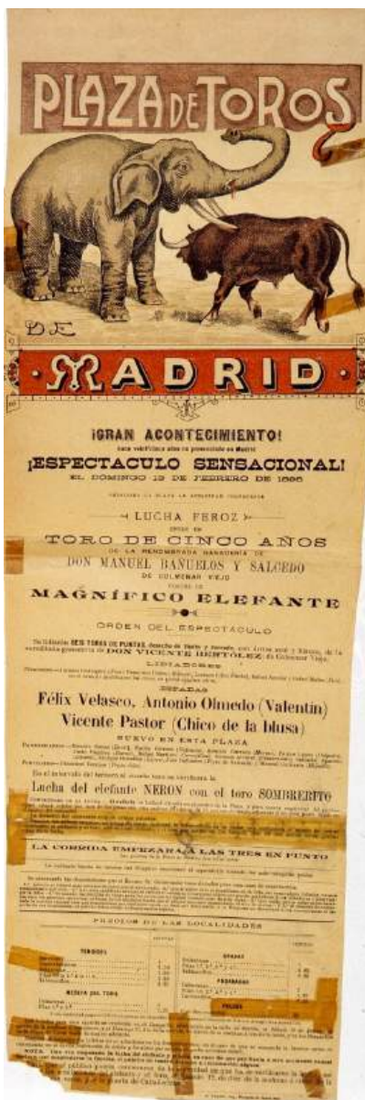
Cartel anunciador de la corrida del 13 de febrero de 1898 en la antigua plaza de las Ventas de Madrid

y el presidente, a pesar de haber visto que no podía haber lucha, por aquello de que cuando uno no quiere dos no pelean, dispuso que fuera nuevamente amarrado el elefante y que le soltaran otro toro que lo corneara y lo hiriera alevosamente. Sujeto otra vez con una maroma, abren el toril a uno de los de Bertólez, que resultó más codicioso que el anterior y que era más fino de pitones. Le arremete de salida hiriéndole y nuevamente se desata el elefante por haberse aflojado el nudo de la cuerda. Hasta nueve veces le acometió el toro, produciéndole otras tantas heridas aunque ninguna profunda, derribándolo una vez frente al tendido 10, sin que el pobre animal hiciera nunca por defenderse. Lo que hubiera sido lucha interesante de haberse tratado de un elefante de más edad y menos mansedumbre, se convirtió en una salvajada; porque salvajada entiendo que es, y el presidente no debió autorizarla, el amarrar a un pobre animal noble y manso como criado a mano y que huye y brama asustado cuando el toro lo persigue, para que este le cornee y lo hiera impunemente.