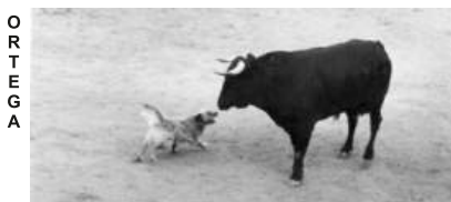
E L P E R R O O R T E G A