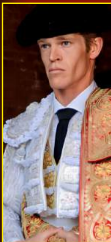
BORJA JIMÉNEZ MATADOR DE TOROS REVELACIÓN TEMPORADA 2023